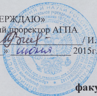
ГРАФИК УЧЕБНОГО ПРОЦЕССА

факультета технологии, экономики и дизайна по заочной форме обучения на 2015 – 2016 учебный год