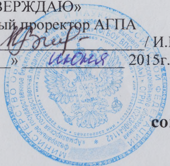
ГРАФИК УЧЕБНОГО ПРОЦЕССА

социально-психологического факультета по заочной форме обучения на 2015 – 2016 учебный год